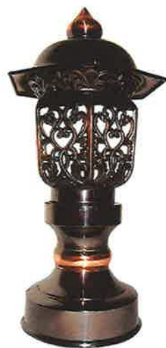
④唐草灯6号(ブロンズ)