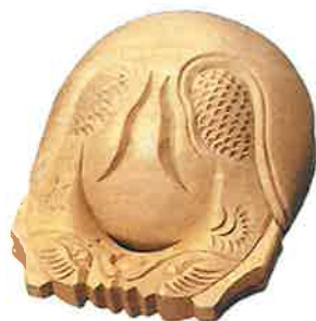
⑬ 柰倍 (白木)