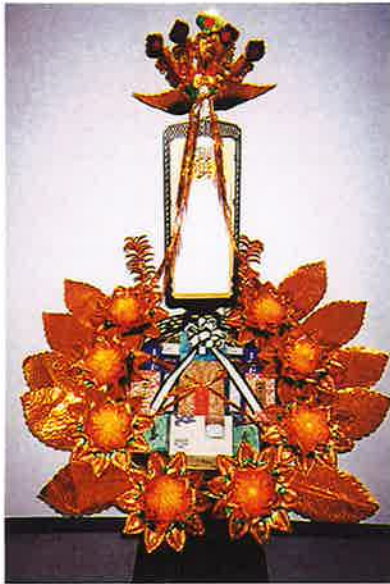
線香・ろうそく盛籠