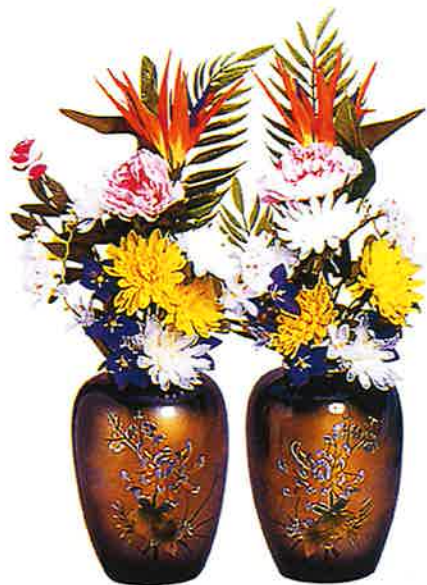
① アルミ夏目花瓶 1対

このカタログに掲載されている商品の価格につきましては、予告なく変更する場合がございます。