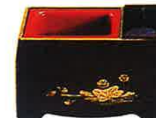
⑧ 5寸香炉 (PC黒フチ金蓮)