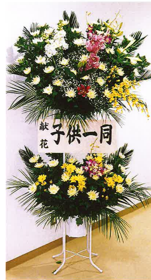
④二段生花 22,000円 (税込)