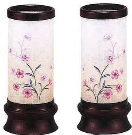
かのん 花音(回転付)