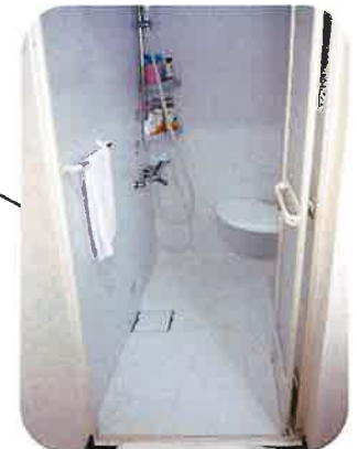
ユニットシャワー (1.65㎡)