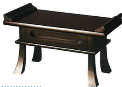
⑦ PC焼香盆 (朱・黒)