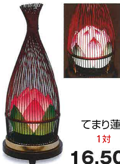
てまり蓮華(タメ色)