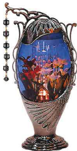
②エスプリブルー・ブラック