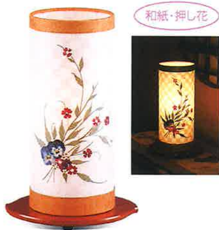
むそうばな 夢想花1号