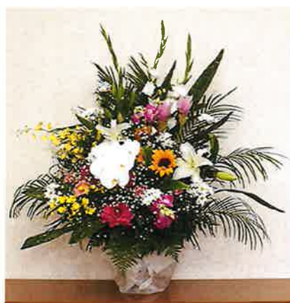
②アレンジ生花 11,000円 (税込)