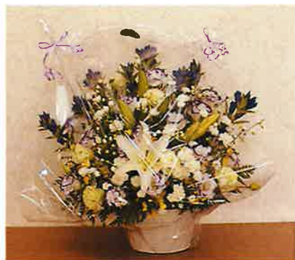
①アレンジ生花 5,500円 (税込)