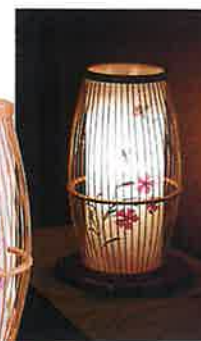
きょうちく 京竹1号(タメ・白木)