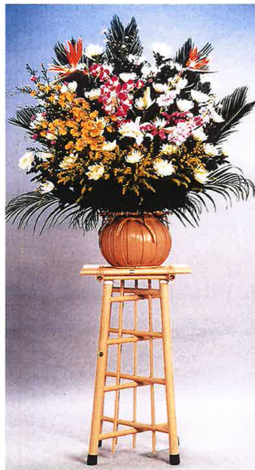
③ダルマ籠生花 16,500円 (税込)